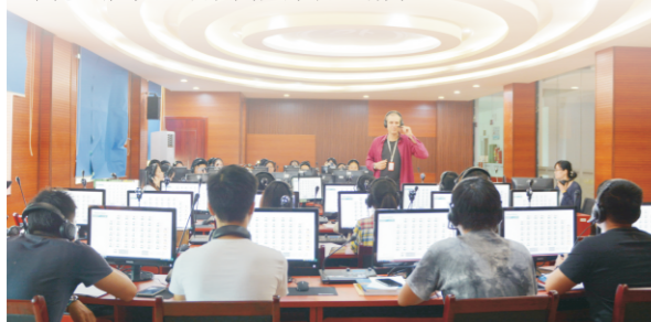
学校法语专业学生在可视化同声传译实验室上课

● 就业方向： 毕业后可在经贸、涉外企业、教育等行业（部门），尤其能在与法语国家有交流的或在法语地区开发业务的企业从事翻译、外贸、法语教学、文化交流等工作；亦可报考国家公务员、攻读国内外硕士或自主创业。