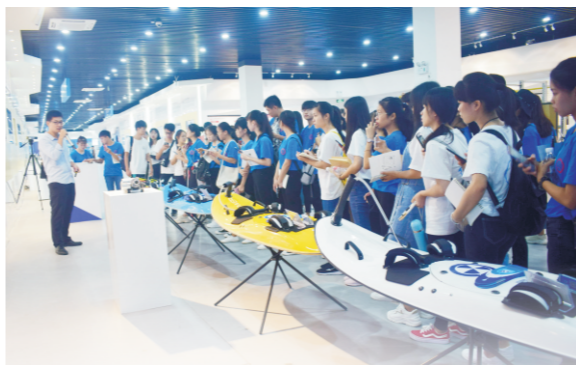
学校市场营销专业学生到南宁市第二象限环保科技有限公司参观学习“互联网+”“废纸回收平台”

● 就业方向： 可从事创新创业型公司CEO、职业经理人、营销总监、策划创意总监等，尤其擅长面向东盟国家和地区的市场调研、营销策划、多媒体传播、市场开发、品牌建设、商务拓展等方面工作；亦可考取国家公务员或国内外攻读硕士或自主创业。