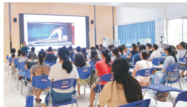
学校泰语专业学生在VR虚拟现实教室进行泰语翻译培训

● 就业方向： 毕业后可在外经贸、教育、旅游、外事、文化、新闻出版等行业部门从事翻译、教学、管理等工作；亦可考取国家公务员或国内外攻读硕士或自主创业。