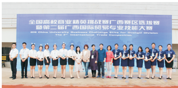
学校国际经济与贸易学院学生喜获第二届广西国际贸易专业技能大赛两项三等奖

● 就业方向：毕业后可在各种对外经济贸易机构、驻外办事机构、外贸公司、国际合作公司、跨国企业、“三资”企业、涉外金融机构、国际货物运输物流企业等从事对外贸易的进出口业务及国际运输物流业务、报检、报关、商务管理及国际市场营销和国际投资、国际经济合作项目管理工作；亦可考取国家公务员或国内外攻读硕士或自主创业。