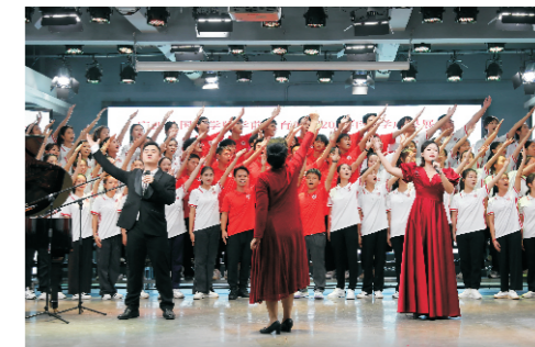
2022年专业展演师生大合唱