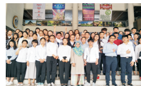
学校酒店管理专业学生在马来西亚北方大学交换学习