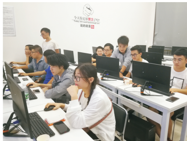
学校软件工程专业学生在中软国际开展实习实训

● 就业方向：毕业后可在IT行业、企事业单位从事计算机应用软件系统的设计开发、工程管理、运行维护、技术服务和软件测试等方面的工作；亦可考取公务员或国内外攻读硕士或自主创业。